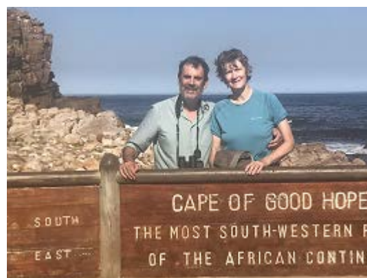
南アフリカの喜望峰にて