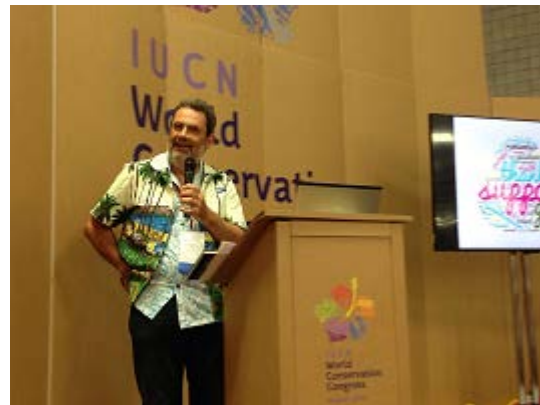
2016年IUCN世界会議(ハワイ)

こともありました。つまり彼らは経済的に価値のある生物を絶滅危惧種に登録することを望まないのです。1996年に新しいカテゴリーと基準を用いた IUCN レッドリストを発売した時、クロマグロやニシマダラを絶滅危惧種としてリストに載せました。何か国かの政府の漁業関連機関が強い不快感を示しました。そういう機関の科学者と付き合うにあたり、私たちは政治的な反対と水産科学者から提起される純粋に科学的な問題とを分ける必要がありました。こういった全ての問題に取り組むことで、それでも政治的圧力に屈しないことで、私たちは今日ある IUCN レッドリストを作ることができたのです。これは、最も客観的で、信頼でき、透明性のある世界中の種の状況に関するデータ集です。レッドリストの評価は様々なことに使われています。保全のための資金集めができるようにある種に注意を喚起したり、政府が介入して脅威に立ち向かえるようになったりすることもあります。例えば、絶滅危惧種の生息地の経済的な開発を差し止めたりしました。また、IUCN レッドリストは、種を脅かさないようにどこに道路を建設すべきかを定めるための重要なデータを提供したり、インフラ計画に投資すべきかどうかを判断するために銀行が使ったりします。IUCN レッドリストの用いられ方は、私たちの想像をはるかに超えており、レッドリストが社会的価値を持ち、広く信頼されていることは嬉しく、とても感謝しています。