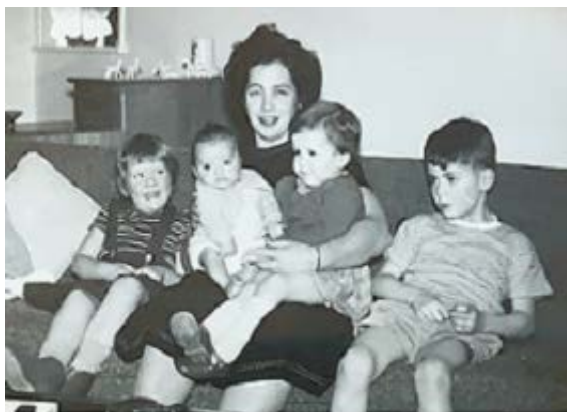
母と兄弟たちと(本人は右端)

私は1956年 イギリスのウエスト・ミッドランド州にある小さな村で生まれました。父はエンジニアで、母は酪農に関心のある人でした。幼いころは大きな庭のある家で花や鳥の観察をしていました。6歳の頃イギリス南部のドーセット州の町に引っ越したのですが、田園地帯のすぐ近くで野生生物に囲まれて育ったことは、私にとって大きな幸運でした。とても温暖な場所で、国内で一般的に見られるような動植物とは異なる種類の生き物がたくさんいました。珍しい鳥や爬虫類、両生類など多くの生き物に関心を持ち自然の中を自由に動き回っていました。