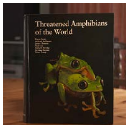
絶滅危惧種の両生類を紹介した本

の専門家と協働し、当時発見されていた 5743 種の両生類全てを調査しました。3 年という年月を費やして IUCN レッドリストにデータを入力しました。その結果、およそ 3 分の 1 の両生類が世界的に絶滅の危機に瀕していることがわかりました。その原因は 3 つです。最大の原因としては生息地の消失、次に病気、特にツボカビ症という菌性の病気によるもの。このツボカビ症は野生の環境では実質的な治療法がない病気です。そして 3 つ目の原因は乱獲です。これらの原因は人間が引き起こしたものと言えます。明らかに、ツボカビ症自体は人間が故意に世界に広めたものではありません。しかし、発生源と言われているアジアから、グローバル化による物資の移動やペットや食料が流通する過程で世界に広まったという点においては、人間の関与も否定できません。両生類のほとんどが水陸の両方に生息するため、水辺の環境と陸地の環境の両方から大きな影響を受けてしまうがゆえに、危機に対して脆弱な存在なのです。世界両生類アセスメントにより、地球の環境がまだ非常に悪化した状態であること、生物の多様性が脅かされていること、そして優れた保護活動が必要であることがわかったのです。